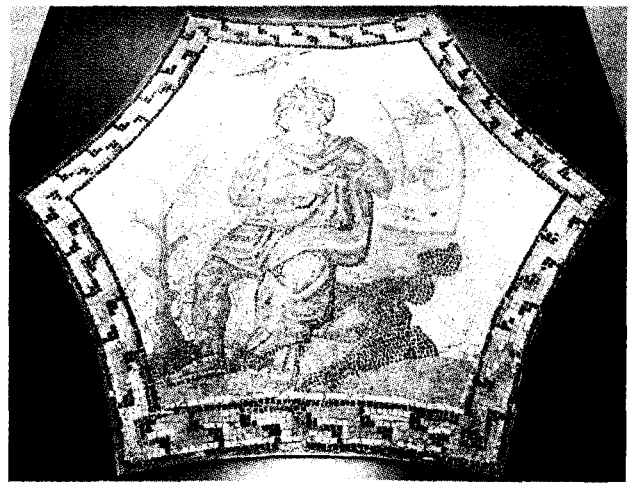
Antik mozaik még az I. században a császári Rómában készült

antik mozaikot is kiállít. A római császár korabeli (azaz isz. 250–350 közötti) művet a mú-